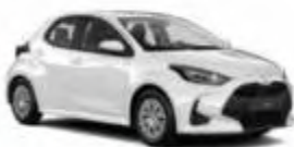
Klein / Toyota Yaris o.ä.

Hier sehen Sie eine mögliche Fahrzeugauswahl der verschiedenen Kategorien: z.B.