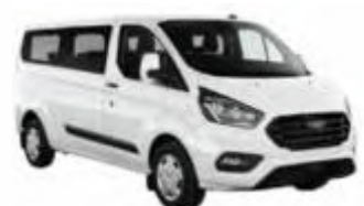
Minibus / Ford Transit o.ä (9-Sitzer)