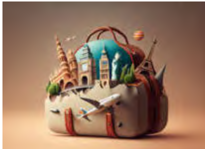
Paradiesische Inselwelt Aland

Aufgrund unterschiedlicher, flexibler Preissysteme arbeiten die meisten Fluggesellschaften mit tagesaktuellen Preisen, die sich u. a. an der Auslastung/Verfügbarkeit, Saison, Tarifklasse etc. orientieren, sodass uns eine verbindliche Darstellung der Preise nicht möglich ist.