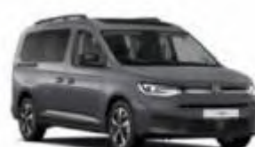
Van / VW Caddy o.ä. (7-Sitzer)