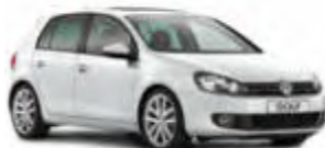
Kompakt / VW Golf o.ä.