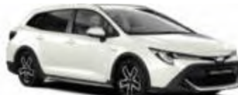
Mittelklasse / Toyota Corolla STW o.ä.