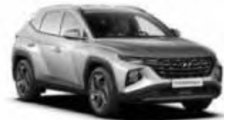
N3 / Hyundai Tucson o.ä.