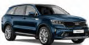
O6 / Kia Sorento o.ä.