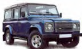
G6 / Landrover Defender o.ä.