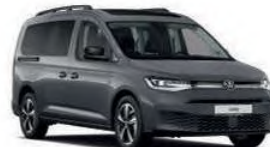
Van / VW Caddy o.ä. (7-Sitzer)