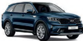
O6 / Kia Sorento o.ä.