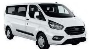
Minibus / Ford Transit o.ä (9-Sitzer)