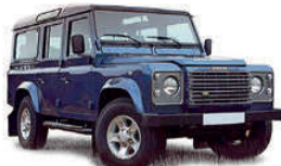
G6 / Landrover Defender o.ä.