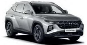
N3 / Hyundai Tucson o.ä.