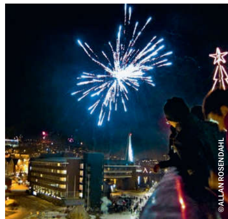
Silvester an Bord

Der Routenverlauf beschreibt die Reise Weihnachten und Silvester. Der Verlauf ist für alle drei Reiseternine gleich.