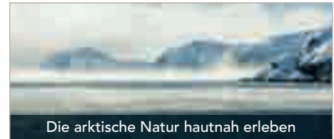
Die arktische Natur hautnah erleben