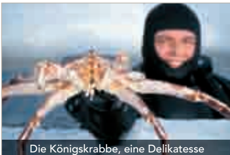
Die Königskrabbe, eine Delikatesse