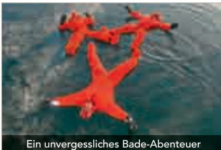
Ein unvergessliches Bade-Abenteuer