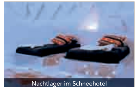
Nachtlager im Snowhotel