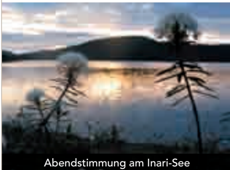
Abendstimmung am Inari-See

Entlang des Inari-Sees geht es nach Sevettijärvi, mit Besuch einer russisch-orthodoxen Holzkirche. Nach Überquerung der finnisch-norwegischen Grenze erreichen Sie Kirkenes.