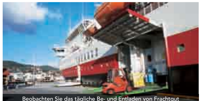
Beobachten Sie das tägliche Be- und Entladen von Frachtgut