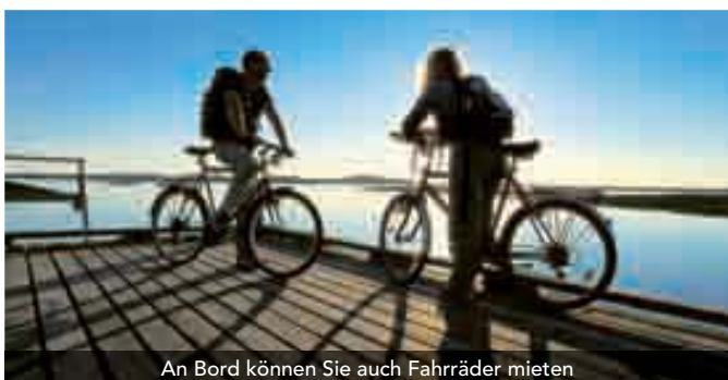
An Bord können Sie auch Fahrräder mieten

Weitere Informationen finden Sie auf unserer Webseite unter: www.hurtigruten.de