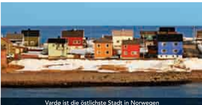
Vardø ist die östlichste Stadt in Norwegen

Svolvær ist das regionale Zentrum der Lofoten