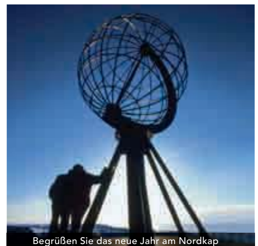
Begrüßen Sie das neue Jahr am Nordkap