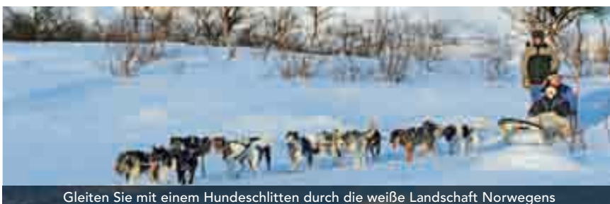
Gleiten Sie mit einem Hundeschlitten durch die weiße Landschaft Norwegens

Morgens legen Sie in Trondheim an. Transfer zum Flughafen und Rückreise per Linienflug nach Deutschland.