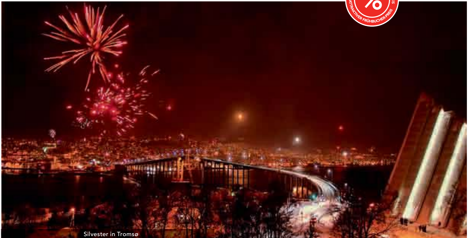
Silvester in Tromsø