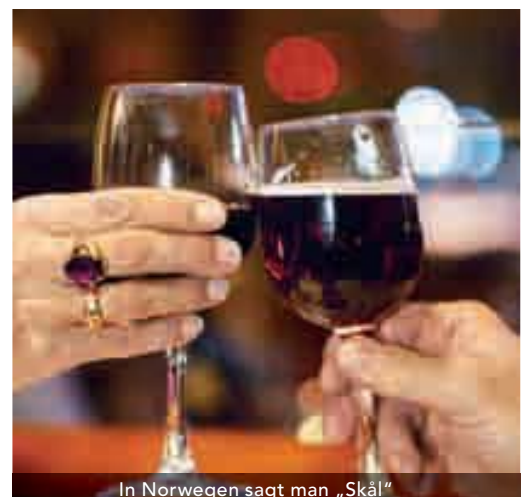
In Norwegen sagt man „Skål“